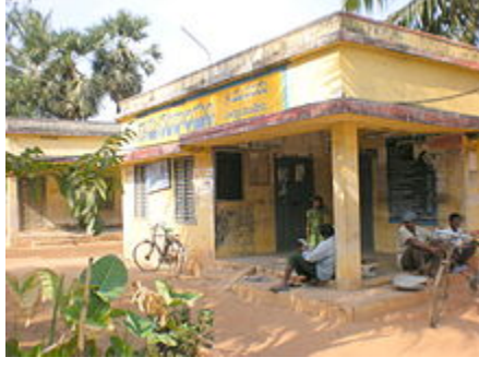
గ్రామ పంచాయతీ సముదాయ భవనం